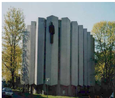
Den Amerikanske Kirke på Frogner i Oslo. Her holdes mange av møtene i PF regi.

Det var godt og sterkt å få et slikt besøk. Det er derfor en glede å se at også vårt justisvesen ser positivt på arbeidet som er under sterk utvikling.