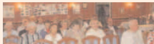
Utsnitt av forsamlingen