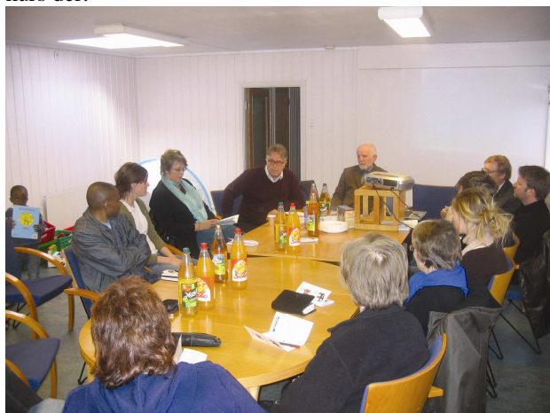
Her er et bilde fra møtet. Bildet er tatt like før pizza-serveringen.

Målet med møtet var å starte en gruppe som kan besøke fengslet i Trondheim, og kanskje starte Alpha-kurs der.