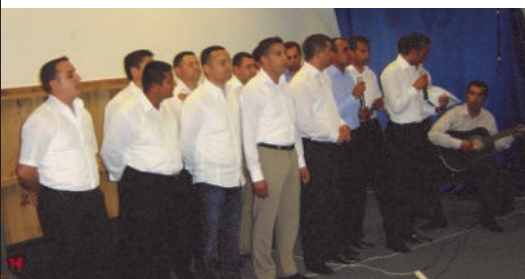
Sigøynerkor synger på barnehjem drevet av PF-Romania, der vi hadde enkelte samlinger

Mye av det som Prison Fellowship gjør i utlandet er det stort behov for også hos oss, blant annet av forsoningsprogrammer og ettervern. I årene fremover vil det være bra om vi får til mer overføring av internasjonal forskning, praksis og erfaring – andre kommer gjerne og hjelper oss, og mye av arbeidet i Vest-Europa er lett å overføre til våre forhold. Vi som var i Romania nå vil også finne anledninger til å dele det vi lærte.